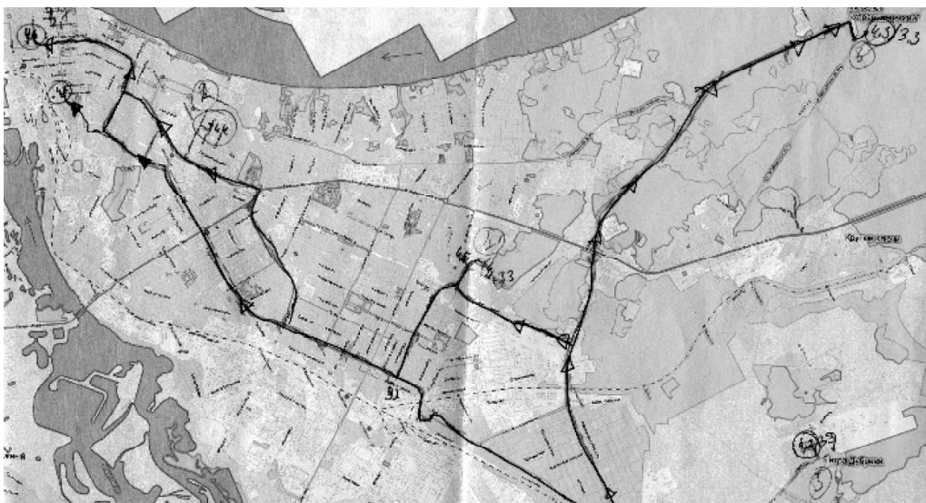
Рис. 4. Передвижения по большей части территории Самары

Все вышеперечисленные фигуры относятся к сравнительно небольшим масштабам осваиваемой территории. Когда же расстояние между локациями достаточно большое, то рисунок ментальной карты приобретает сложную неправильную форму. Маршруты и места создают разветвленную сеть передвижений горожанина по Самаре. Здесь можно встретить и скопления локаций на небольшой территории, и вытянутые маршруты, и неправильные многоугольники.