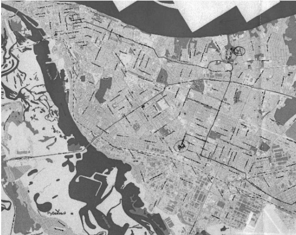
Рис. 2. Вытянутый маршрут

Наиболее часто встречающаяся фигура — вытянутый маршрут, ломаная, состоящая из множества точек и двух-трех ответвлений от нее. Самара выглядит на таких картах как маршрут малой или средней протяженности, зачастую протянутый параллельно Волге. По движению этой линии, как правило, формируются узлы, в которых происходит скопление дополнительных мест посещения. Они могут представлять собой только точки, не соединенные друг с другом маршрутными линиями. Иными словами, респондент выбирает места для отдыха, встречи с друзьями вдоль главного маршрута, незначительно отклоняясь от него. На таких картах Самара видится компактным городом, где движение и активность выстраиваются вдоль главной незамкнутой ломаной линии с узлами локаций-активностей.