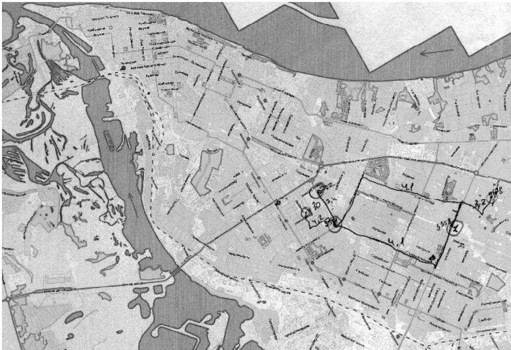
Рис. 3. Многоугольник

Все вышеперечисленные фигуры относятся к сравнительно небольшим масштабам осваиваемой территории. Когда же расстояние между локациями достаточно большое, то рисунок ментальной карты приобретает сложную неправильную форму. Маршруты и места создают разветвленную сеть передвижений горожанина по Самаре. Здесь можно встретить и скопления локаций на небольшой территории, и вытянутые маршруты, и неправильные многоугольники.